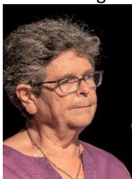
Ruth Dreifuss, ancienne Conseillère fédérale

Plus d'informations sur l'assemblée des déléguées sur notre site .