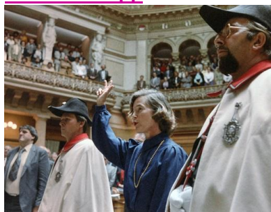
Election comme conseillère fédérale le 2 octobre 1984

Elisabeth Kopp, la première femme conseillère fédérale de Suisse, est décédée le 14 avril 2023.