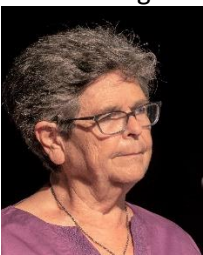
Ruth Dreifuss, alt Bundesrätin

Mehr zur Delegiertenversammlung auf der SVF-Website